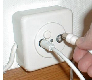
Branchez le câble que vous venez d'acquérir (la fiche mâle)