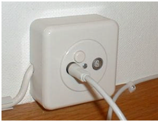
Repérez la prise du télé-réseau