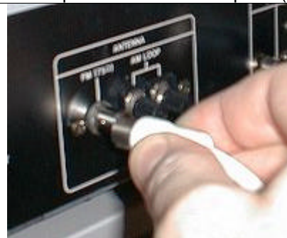
Branchez-y l'autre bout du câble (la fiche femelle)