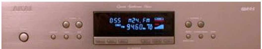
Réglez votre tuner sur 94.6 MHz pour recevoir Mix24

Certains récepteurs plus anciens ont une entrée d'antenne femelle et nécessitent un adaptateur mâle/mâle afin de pouvoir y connecter le câble. Vous trouverez le câble et l'adaptateur éventuel chez Interdiscount, Media markt, à la FNAC ainsi que dans d'autres magasins.